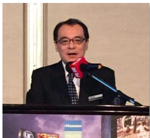
片山 G 长