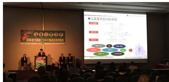
諏访 G 长